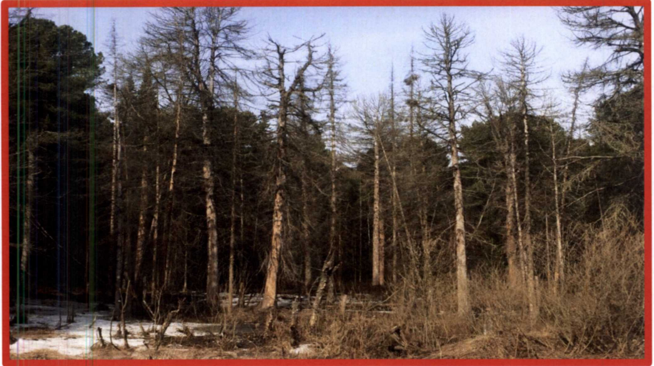
Изображение № 4 Сухостойное дерево. Не является валежником Изображение № 5

Кроме того, необходимо обратить внимание, что деревья, которые лежат на земле, но не имеют признаков естественного отмирания (имеют зеленую листву или хвою), определять как «мертвые» не допускается ( смотри изображение № 5 ).