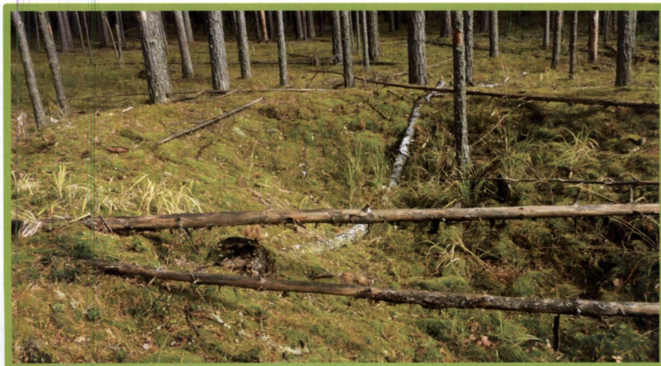
Изображение № 1 Валежник

Примеры валежника (смотри изображения №№ 1,2,3).