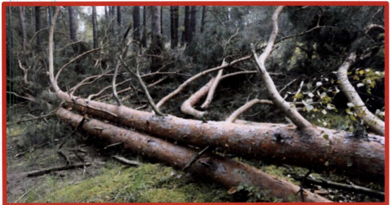
Лежащее на поверхности земли ветровальное дерево, не имеющее признаков отмирания. Не является валежником

Кроме того, необходимо обратить внимание, что деревья, которые лежат на земле, но не имеют признаков естественного отмирания (имеют зеленую листву или хвою), определять как «мертвые» не допускается ( смотри изображение № 5 ).